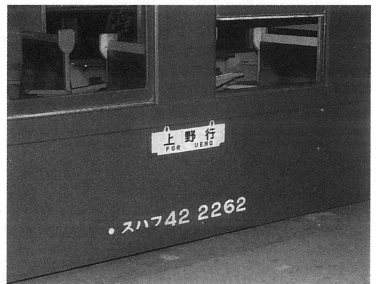
懐かしい客車のサボ 1982.11 ミツ谷政久

TETSUDŌTOSHO KANKŌKAI Oak Ochanomizu Bldg., Kanda Ogawamachi 3-8 Chiyodaku, Tokyo/Japan